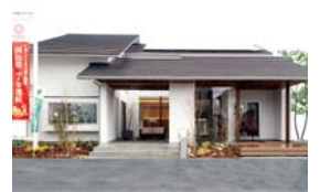
Life Design KABAYA